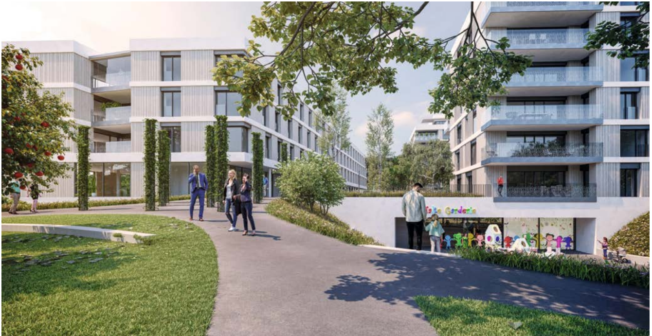
«Horizons Dorigny»: Modernes Wohnprojekt in Chavannes-près-Renens (VD).