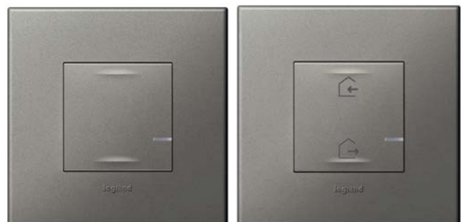
Smarter Lichtschalter und Szenenschalter von Legrand.